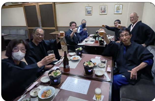
1/14～15 指導員雪上研修会 いわや旅館にて“乾杯”