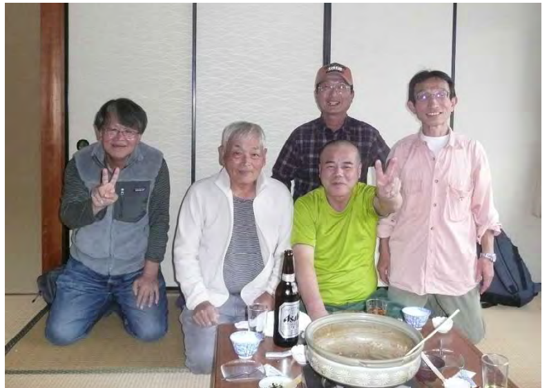
美味しいぼたん鍋を食べて満足そうな顔！

ちょうどこの日は天気も大変よく、清滝の紅葉も大変きれいに色づきはじめていました。朝はひんやりしていましたが、登り始めるとだんだん暑くなり、着込んできた服を脱ぎながら登りました。いい天気であったこともあり、登山客も大変多く並んで登っていくこともし