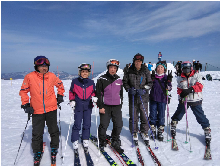
良い天気で眺めも最高でした

皆さんありがとうございました。来年のコンディションのいい時に再会しましょう。よろしく。