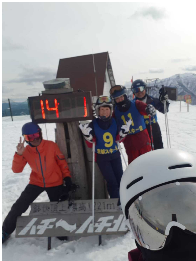
スキー場頂上でのスナップ写真