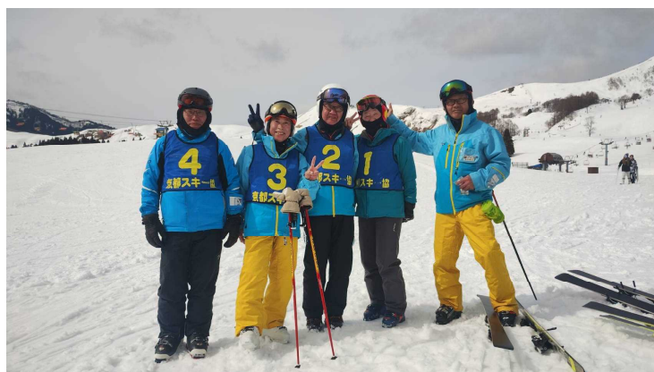
森田班のスナップ写真

先ほど帰宅し、今コタツに潜り込んでいます。皆さまには本当にお世話になりありがとうございました。滑れるかなあとの不安は、どこかに吹き飛び楽しい2日間でした。これからも、いっぱいいっぱいご迷惑をおかけするとおもいますが、よろしくお願いします。