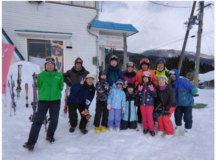
みんなで記念写真