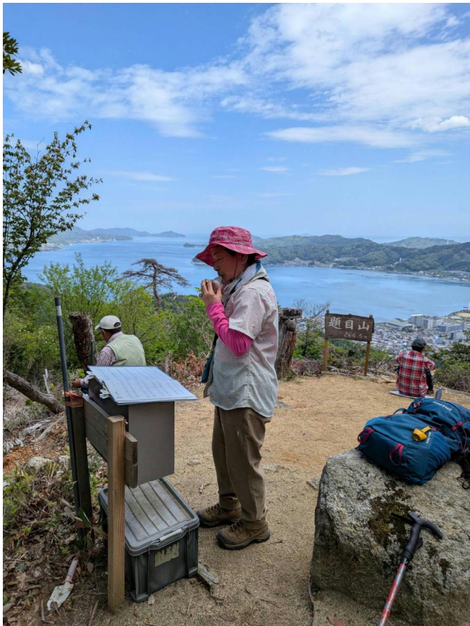
頂上でのオカリナの演奏 皆さんの疲れも吹っ飛びます。