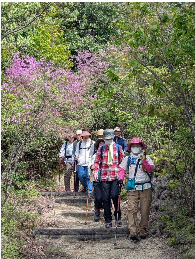
ツツジを見た後は一旦下ります