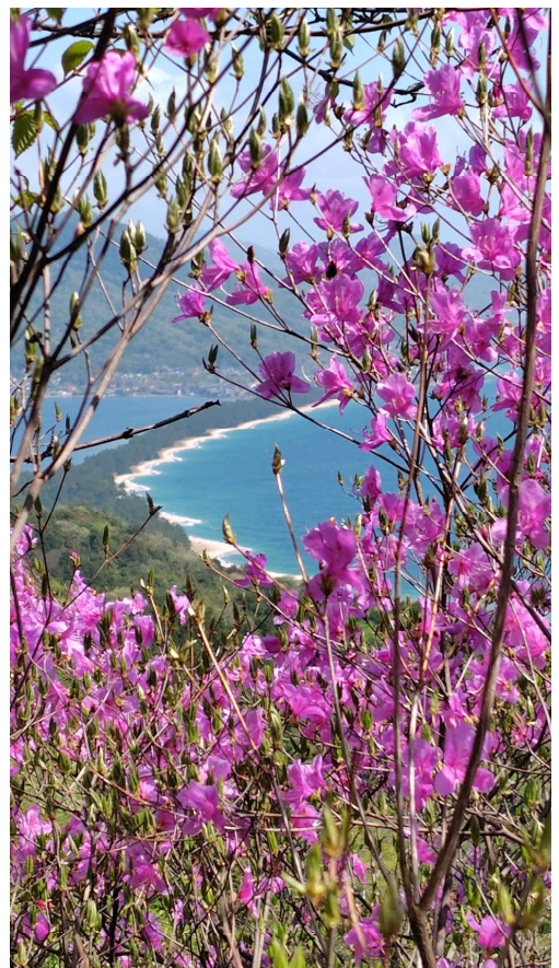
ミツバツツジの向こうは天橋立