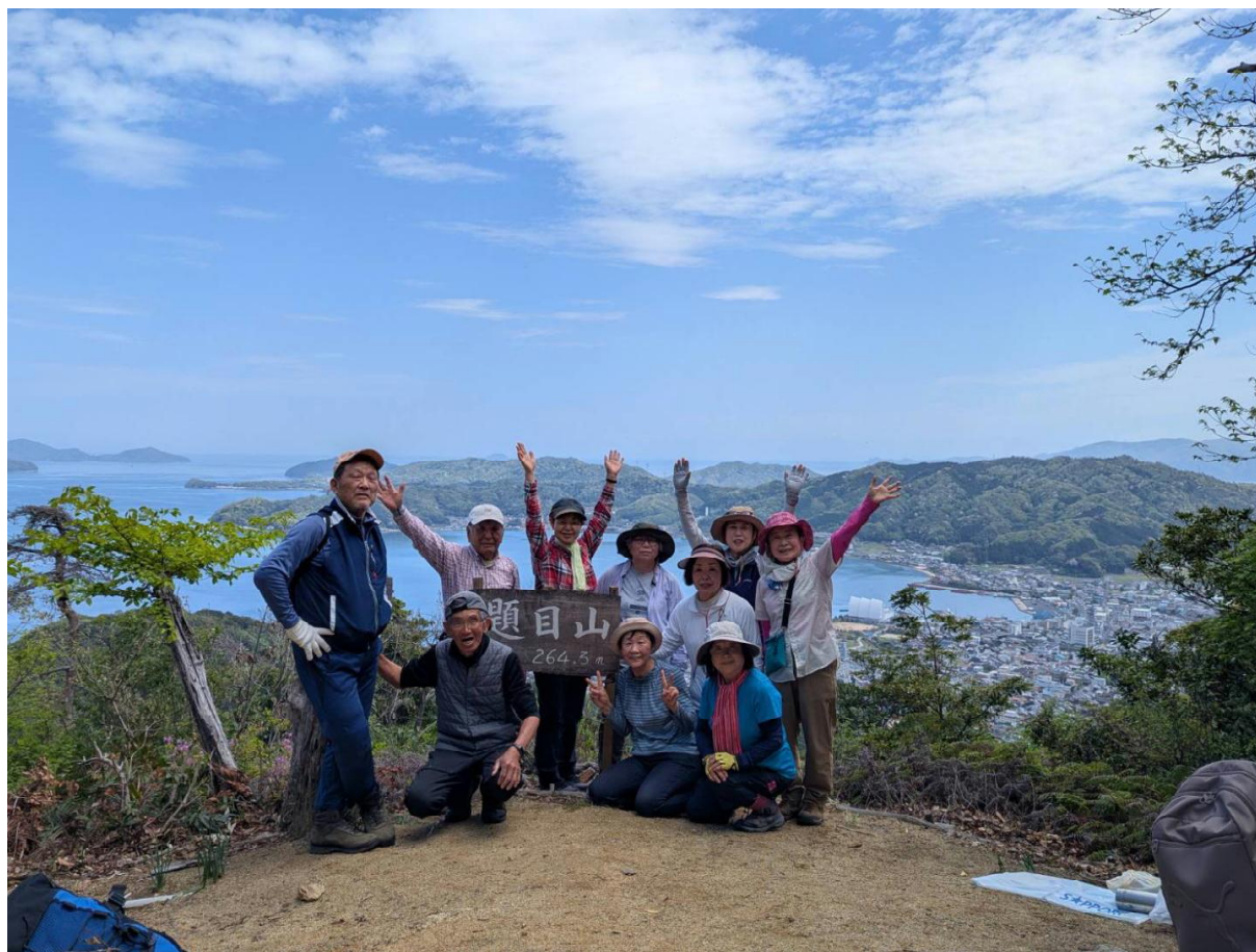
頂上にてパチリ（後ろ宮津市内・宮津湾～伊根湾を望む）

4月20日（月）に、ハイキング例会を行いました。行き先は、宮津の題目山でした。滝馬の金引の滝の奥の駐車場に車を置いて往復の行程でした。